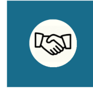
Reception & Catering Hall